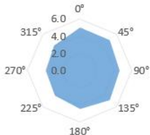
图 2 感知范围示意图