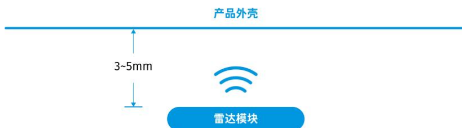
图 3 天线面与产品外壳的距离