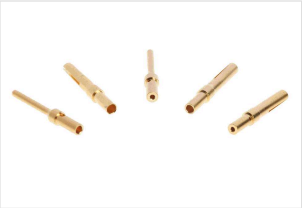
图片仅用于说明。请参考产品描述。