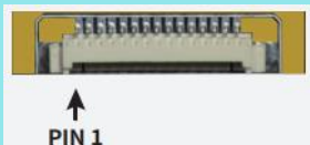
FPC连接器 (15Pin , Pin间距 1.25mm)