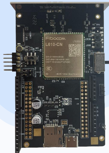
长*宽*高: 96 * 70 * 31 (mm)