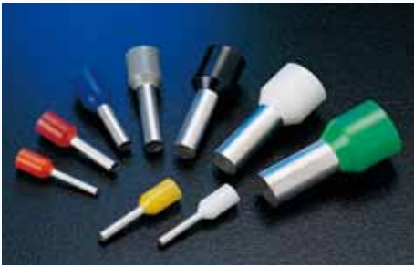
1506 歐式端子 CORD END TERMINAL