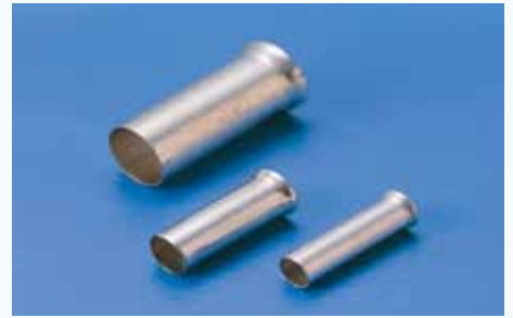
1506 歐式裸端子 NON-INSULATED CORD END TERMINAL