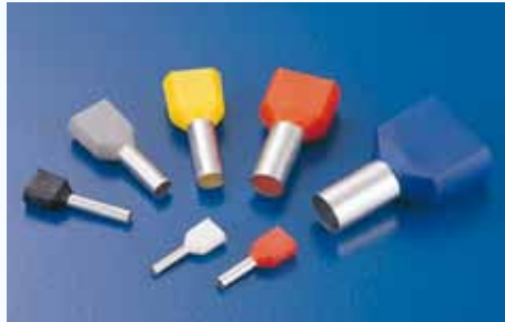
1506 雙線套歐式端子 TWIN CORD END TERMINAL