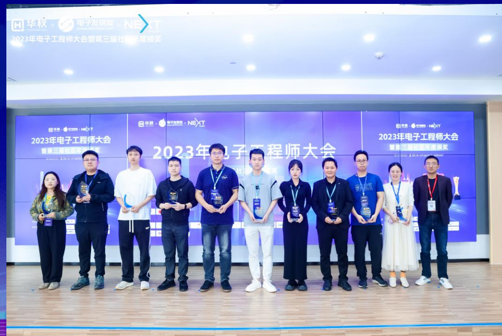
社区优秀产品评测代表 领奖留念