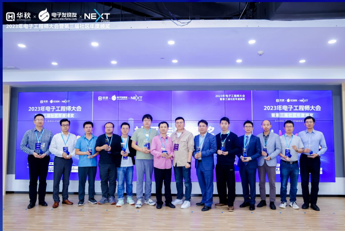
社区专家领奖留念