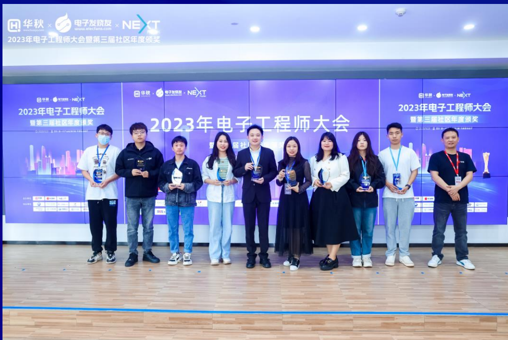
社区优秀合作伙伴代表 领奖留念