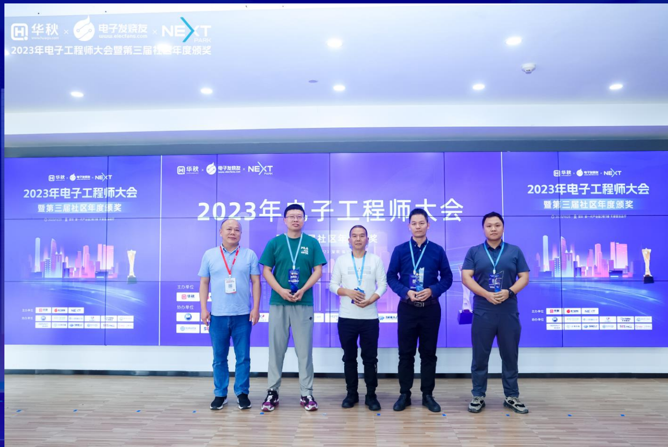
社区领奖代表 领奖留念