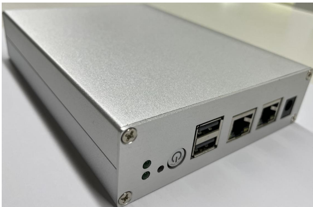
广东龙芯 2K1000 星云板整机图